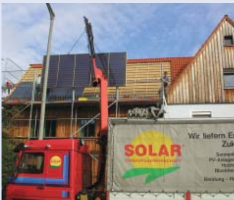
Kranmontage spart Zeit und macht wetterunabhängig.

Eine gute Wärmedämmung, eine ideale Ausrichtung nach Süden, jetzt fehlten nur noch die Sonnenkollektoren und der Wärmespeicher. Hier wurde die Solog Solar-Einkaufsgemeinschaft in Zwiessel aktiv. Sie fertigte vier maßgeschneiderte Hochleistungsflächenkollektoren mit je zehn Quadratmeter Fläche und hievte sie innerhalb kürzester Zeit mit dem Kran auf das Dach.