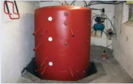
Der Solarspeicher wurde einen Meter tief im Boden versenkt.