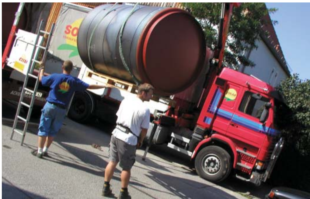
Ein großer Moment: Der Solarspeicher, hier noch in Einzelteilen zusammengesetzt, wird angeliefert.

Flash Filmstudio GmbH Eintrachtstraße 18-20 50668 Köln Tel. 0221 / 160 610 Fax: 0221 / 160 61 61 flash-film@t-online.de www.sachgeschichten.com