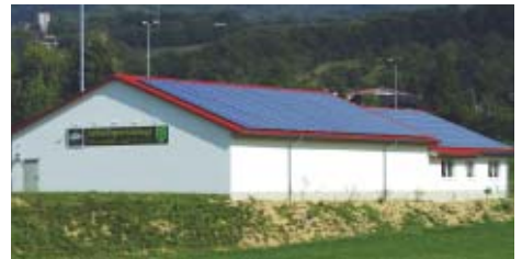
Drei Anlagen mit insgesamt 50 kWp Leistung fanden auf dem Dach dieses Vereinsheimes Platz.

So rundum gut abgesichert, steht dem langfristigen, sorglosen Betrieb Ihres Solarkraftwerks nichts mehr im Wege. Sepp Weindl