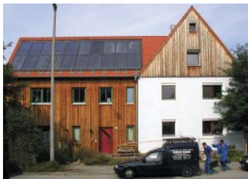
Auch Altbauten können zu Sonnenhäusern umgerüstet werden.

Mit seinen dünnen Außenwänden aus Bimsbetonsteinen war das Einfamilienhaus aus dem Jahr 1958 bis vor kurzem noch ein typischer