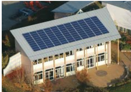
In Frickingen am Bodensee schmückt eine 11,39 kWp-Anlage das Dach der Grundschule.

Wie bei allen Versicherungen gilt auch hier: Der Teufel steckt im Detail. So schreiben einige Gesellschaften den internen Schutz der Anlage durch Überspannung zwingend vor, andere definieren bei Sturmschäden eine Mindest-Windgeschwindigkeit von 216 km/h. Es gilt: Augen auf und das Kleingedruckte aufmerksam studieren.