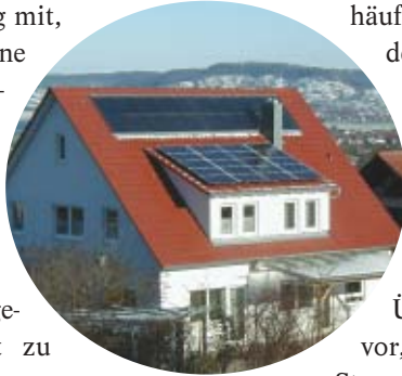
Eine maßgeschneiderte Anlage gab es für diese Gaube im schwäbischen Oberndorf.

Für die Versicherung von Solarstromanlagen gibt es zwei Möglichkeiten. Entweder Sie versichern Ihre Anlage im Rahmen der Gebäudeversicherung mit, oder Sie schließen eine eigene Anlagenversicherung hierfür ab. Auf jeden Fall sollten Betreiber es sich von ihrem Versicherer schriftlich bestätigen lassen, dass ihr Solarkraftwerk in die Gebäudeversicherung eingeschlossen ist. Dabei ist zu beachten, dass die Versicherungssumme erhöht und an die Wertsteigerung des Gebäudes durch die Solarstromanlage angepasst wird.