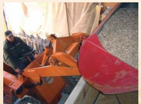
Ewald Tröster beim Auffüllen des Hackgutbunkers

Über eine Raumaustragungsschnecke mit Rührwerk wird der Hackgutkessel automatisch mit Brennstoff aus dem Hackgutbunker versorgt. Dieser kann bequem mit dem Traktor beladen werden.