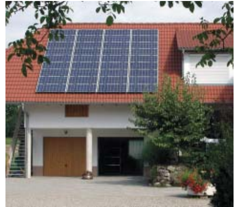
Die 4-kWp-Anlage passt perfekt auf das Garagendach.

Module, Wechselrichter, Installationsbetrieb... Wer eine Solarstromanlage plant, hat so einiges zu bedenken. Nicht dabei vergessen werden sollte die Frage der Versicherung. Da die abzudeckenden Risiken noch vor der Inbetriebnahme beginnen, empfiehlt es sich, den ausreichenden Schutz bereits in der Planungsphase mit zu berücksichtigen.